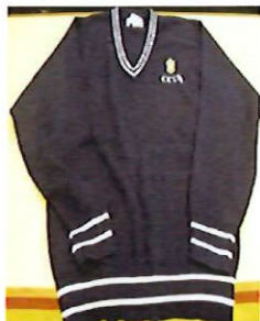
冬季毛衣校服式樣

學生需穿着由校方指定深藍色的羊毛冷衫(邊旁有粉藍色條子)、深藍淨色羊毛冷衫(需配鐵校徽)、黑色外套或深藍色的頸巾，以禦寒保暖。