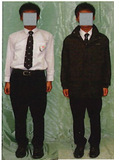
男生冬季校服式樣