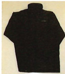
冬季外套校服式樣