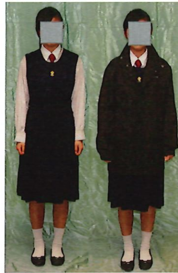
女生冬季校服式樣