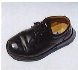
男學生及女學生鞋式樣